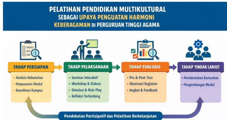
Gambar 1 Metode partisipatif berbasis pelatihan

Metode pengabdian yang digunakan dalam kegiatan ini adalah metode partisipatif berbasis pelatihan ( participatory training approach ) dengan pendekatan pendidikan orang dewasa ( andragogi ).