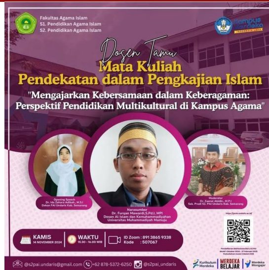
Gambar 2. Tahap persiapan kegiatan

Selain itu, pada tahap persiapan juga ditemukan bahwa mahasiswa cenderung berinteraksi dalam kelompok yang homogen berdasarkan latar belakang organisasi, daerah asal, maupun pemahaman keagamaan. Pola interaksi yang terbatas ini berpotensi menimbulkan eksklusivitas sosial dan memperkuat stereotip. Oleh karena itu, penyusunan modul pelatihan dirancang untuk menekankan pada pengembangan kompetensi komunikasi antarbudaya dan keterampilan resolusi konflik sebagai bagian dari pendidikan multikultural yang aplikatif (Wang et al., 2024). Modul yang dikembangkan memuat materi konseptual, studi kasus kontekstual, serta latihan reflektif.