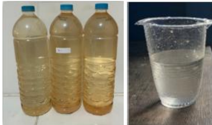
Gambar 3. Kondisi Air: a) Air Baku; b) Air Hasil Olahan dengan Penambahan kapur

Survei terkait kondisi air tanah telah dilakukan dengan tujuan untuk mengidentifikasi permasalahan kondisi air di Desa Sungai Nibung. Air tanah bersumber dari sumur gali hasil swadaya masyarakat. Kondisi fisik air tanah berwarna kuning, keruh dan berbau besi (Gambar 3). Masyarakat setempat menggunakan kapur sebagai penjernih air. Air yang dihasilkan jernih, namun aroma besi tidak hilang. Oleh karena itu, air ini perlu diolah kembali sehingga layak untuk digunakan. Pengolahan air bersih yang dapat dilakukan secara sederhana di lokasi tersebut adalah penambahan tahapan aerasi dan sedimentasi sebelum dilakukan filtrasi.