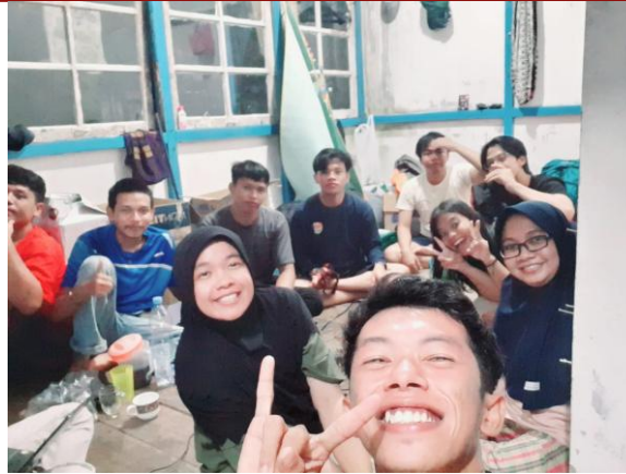
Gambar 2. Diskusi Awal dengan Mitra

Survei terkait kondisi air tanah telah dilakukan dengan tujuan untuk mengidentifikasi permasalahan kondisi air di Desa Sungai Nibung. Air tanah bersumber dari sumur gali hasil swadaya masyarakat. Kondisi fisik air tanah berwarna kuning, keruh dan berbau besi (Gambar 3). Masyarakat setempat menggunakan kapur sebagai penjernih air. Air yang dihasilkan jernih, namun aroma besi tidak hilang. Oleh karena itu, air ini perlu diolah kembali sehingga layak untuk digunakan. Pengolahan air bersih yang dapat dilakukan secara sederhana di lokasi tersebut adalah penambahan tahapan aerasi dan sedimentasi sebelum dilakukan filtrasi.