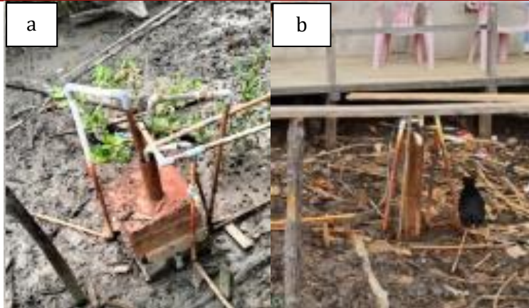
Gambar 4. Sumur: a) S1 dan b) S2

Air baku dilakukan pengujian pH, dan salinitas, yaitu 6,47 dan 0,83 ppt. Kandungan zat besi pada air baku cukup tinggi, dapat dilihat dari warna dan hasil endapan setelah ditambah kapur. Kapur memiliki kemampuan menjernihkan air 6-8 jam. Namun, endapan yang dihasilkan cukup banyak pada bak penampungan air dan masih berbau. Oleh karena itu, bahan penjernih air lainnya diperlukan. Air baku diuji terlebih dahulu dengan penambahan bahan kimia, seperti soda ash dan poly aluminium chloride (PAC) (Gambar 6). Hasil proses koagulasi dan flokulasi pada air dari S1 dengan soda ash dan PAC adalah air menjadi jernih dan terbentuk flok besar-berat di dasar dengan waktu 30 menit. Hasil proses koagulasi dan flokulasi pada air dari S2 dengan soda ash dan PAC adalah air menjadi jernih dan terbentuk flok besar-berat di dasar dengan waktu 45 menit. Air dari sumur S1 dengan jumlah koagulan yang ditambahkan 5 mL ( soda ash atau PAC) menghasilkan air olahan yang lebih jernih dibandingkan dengan air dari sumur S2. Hal ini menandakan bahwa kandungan zat besi pada air lebih banyak pada air dari sumur S2 sehingga diperlukan jumlah koagulan yang lebih banyak. Kandungan zat besi pada air tanah dipengaruhi oleh kondisi struktur tanah (Suryadirja et al. , 2021). Besi dalam perairan alami dapat berikatan dengan anion klorida, bikarbonat, dan sulfat membentuk senyawa \text{FeCl}_2 , \text{Fe}(\text{HCO}_3)_2 , dan \text{FeSO}_4 (Iyabu et al. , 2020).