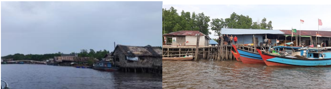
Gambar 1. Desa Sungai Nibung, Kecamatan Teluk Pakedai, Kubu Raya

Berdasarkan Laporan Kinerja Instansi Pemerintah Triwulan I Kecamatan Teluk Pakedai (2024), Desa Sungai Nibung memiliki luas daratan 21,44 km 2 dan luas wilayah air 419 km 2 . Desa ini terdiri dari 3 dusun, 3 RW, dan 3 RT dengan jumlah penduduk 1.113 jiwa. Luas permukiman dan fasilitas lingkungan 305,25 ha dan didominasi dengan hutan lindung bakau dan rawa 4.127, 24 ha. Mata pencaharian masyarakat Desa Sungai Nibung sebagian besar adalah nelayan dan petani.