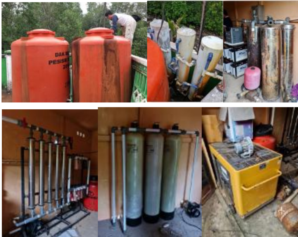
Gambar 6. Sarana dan Prasarana Pengolahan Air di Desa Sungai Nibung

Hasil orientasi lapangan dari sarana dan prasarana pengolahan air, ditemukan fasilitas filtrasi lengkap (Gambar 7). Pengolahan dengan filtrasi air tidak dioperasikan oleh masyarakat dikarenakan besarnya biaya operasional dan kandungan zat besi yang tinggi sehingga kerja filter air menjadi berat. Biaya operasional tinggi dikarenakan belum masuknya listrik pada Desa Sungai Nibung sehingga pengoperasian pengolahan air harus menggunakan genset yang telah ada dan mengkonsumsi BBM yang cukup banyak.