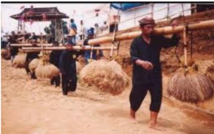
Gambar 01. Contoh masyarakat tradisonal

Masyarakat tradisional adalah kelompok masyarakat yang menjunjung tinggi leluhurnya dan memegang teguh adat istiadatnya. Umumnya masyarakat tradisional memiliki pandangan bahwa menjalankan warisan nenek moyang berupa nilai hidup, norma, harapan, dan cita-cita adalah kewajiban, kebutuhan dan juga kebanggaan. Mereka menganggap jika melaksanakan tradisi leluhur berarti menjaga keharmonisan masyarakat dan apabila melanggar tradisi berarti merusak keharmonisan masyarakat. Masyarakat tradisional sering disebut juga dengan masyarakat primitif yaitu masyarakat yang memiliki penguasaan teknologi yang rendah.