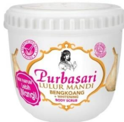
Gambar 3.1 Lulur Purbasari

Lulur adalah ramuan tradisional yang dapat berupa halus. lulur dapat dipoleskan ke seluruh bagian tubuh dengan menggunakan kuas, dapat pula langsung digosok-gosokkan pada kulit tubuh dengan kedua tangan. Lulur bermanfaat untuk menghilangkan kotoran sehingga kulit menjadi lebih halus, mulus, dan bersih. Adapun scrub yang sering digunakan untuk perawatan badan secara berkala dan harian seperti Purbasari, Herborist, Sari Ayu, Vienna, Marina, Viva, dan Sumber Ayu.