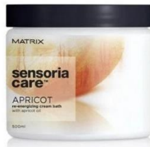
Gambar 4.2 Contoh cream creambath Matrix