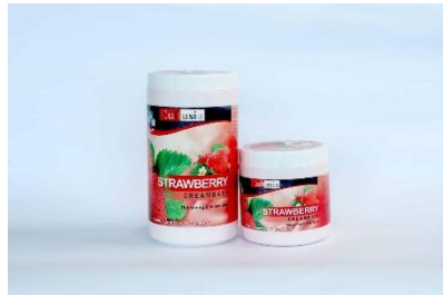
Gambar 4.1 Contoh cream creambath Cultusia

Perawatan kulit kepala dan rambut secara basah (creambath) adalah suatu tindakan perawatan pada rambut dan kulit kepala yang dilakukan dengan cara mengurut/memijat/massage dan dengan Teknik pengurutan yang sudah ditetapkan serta dengan menggunakan kosmetika berupa cream yang diaplikasikan pada rambut sesuai dengan kondisi dan jenis rambut. Pada dasarnya teknik creambath hampir sama dengan masker rambut yaitu krim mengandung nutrisi tertentu dioleskan pada rambut dan kulit kepala kemudian dibiarkan meresap.