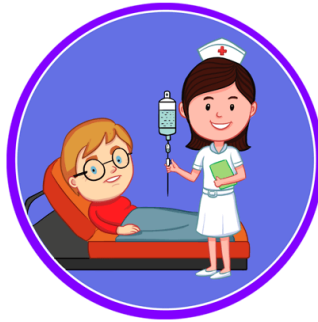
Gambar 1 Keperawatan (Nursing)

Apabila kita membicarakan keperawatan atau nursing serta perawat atau nurse maka mau tidak mau akan berkaitan dengan sistem pelayanan keperawatan secara khusus, dan sistem pelayanan kesehatan pada umumnya.