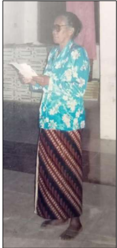
Foto-Foto Doeloe Perhatikan solois – mereka tanpa kasut masuk gedung gereja