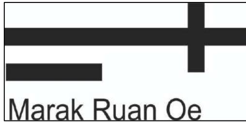
Gambar 1: Marakh Ruan Oe

Leluhur Nai' Feni disebutkan sebagai yang datang dari arah matahari terbit. Mereka datang secara berkelompok. Selama dalam perjalanan jumlah anggota kelompok itu makin berkurang, mengingat ada saja anggota kelompok yang memutuskan untuk menetap di satu tempat yang mereka singgahi karena dia merasa tempat itu baik. Amaf yang memutuskan untuk menetap di Suit oleh rombongan yang melanjutkan perjalanan disebut Nai' Feni karena menurut mereka dia telah mencapai garis akhir, finish .