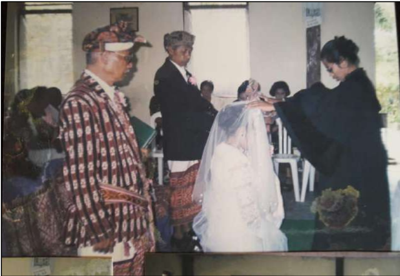
Peneguhan dan Pemberkatan Nikah di Tahun 1990-an Perhatikan kostum. Mempelai bergaya Eropa para saksi mengenakan busana lokal

anak- anak itu sampai lepas susu. Dalam bahasa meto Amarasi, lepas susu disebut sore . Maka oleh orang banyak kampung di mana bayi-bayi itu selamat diberi nama Biniunsore . Anak-anak ini menjadi besar dan melahirkan keturunan yang tidak lain dalam marga Feni.