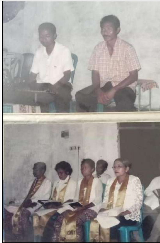
Awalnya hanya laki-laki yang layak jadi pemimpin jemaat Saat ini laki-laki dan perempuan adalah setara

Di penghujung tahun 2018 Mahkamah Konstitusi Republik Indonesia membuat sebuah judicial review terhadap kriteria ini. Dalam amar putusannya Mahkamah Konstitusi melegalkan pencantuman frasa: Penganut Kepercayaan Kepada Tuhan Yang Maha Esa dalam kolom agama di Kartu Tanda Penduduk setiap warga negara Indonesia. Keputusan ini dilatar belakangi oleh adanya perubahan kriteria penetapan sebuah agama. Kriteria itu justru dipegang oleh para sosiolog dan pakar ilmu agama. Menurut mereka penetapan syarat: Kitab, Nabi dan Umat sangat bernuansa politis dan birokrasi. Mereka mengusulkan empat kriteria baru, yakni: Code, Cult, Community and Culture . Agama-agama asli kelompok-kelompok suku di Indonesia diakui sebagai agama karena tiga kriteria itu terdeteksi juga.