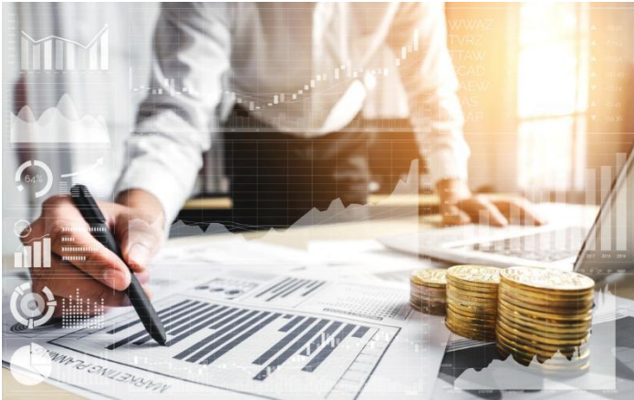
Gambar 6.1. Pengelolaan Keuangan Usaha

Selain itu, pengelolaan keuangan yang baik memungkinkan UMKM lebih mudah mengakses pembiayaan eksternal, karena laporan keuangan yang rapi menjadi salah satu syarat utama lembaga keuangan dalam menyalurkan kredit (Sari et al., 2020). Penelitian Hasmawati et al. (2023) juga menekankan bahwa penerapan aplikasi pencatatan sederhana dapat membantu pelaku UMKM yang belum terbiasa dengan sistem akuntansi formal. Dengan demikian, pengelolaan keuangan usaha bukan sekadar kewajiban administratif, melainkan strategi penting untuk memastikan keberlanjutan, pertumbuhan, dan daya saing usaha di era digital (Widiyanti & Lestari, 2020; Nugroho & Hidayat, 2022)..