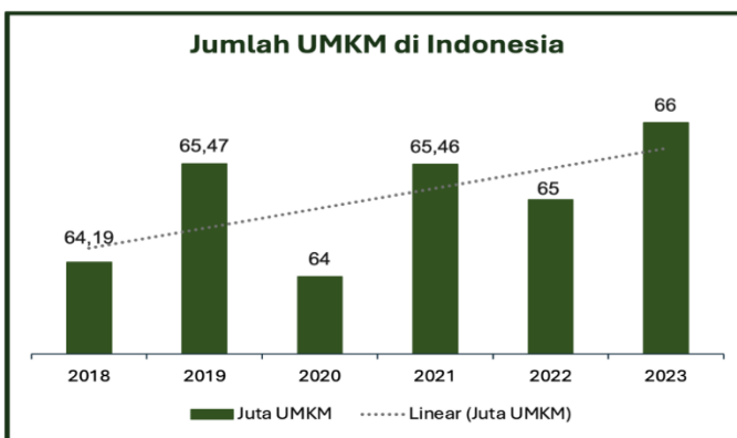
Gambar 1.1 Jumlah UMKM di Indonesia

Usaha Mikro, Kecil, dan Menengah (UMKM) merupakan salah satu pilar utama dalam pembangunan ekonomi Indonesia yang secara fundamental peranannya tidak dapat diabaikan. Dalam beberapa dekade terakhir, UMKM semakin mendapatkan perhatian sebagai sektor yang memiliki dampak luas terhadap pertumbuhan ekonomi, distribusi pendapatan, dan penyerapan tenaga kerja. Data terkini menunjukkan bahwa sampai tahun 2023, jumlah unit UMKM di Indonesia mencapai lebih dari 65 juta usaha. UMKM secara intrinsik merupakan motor penggerak yang tidak hanya berkontribusi pada penciptaan produk dan layanan, tetapi juga memfasilitasi pemberdayaan sosial-ekonomi secara ekstensif di berbagai lapisan masyarakat.