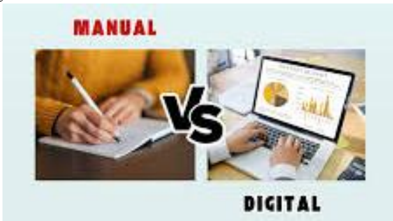
Gambar 7.1. Perbandingan Pencatatan Manual Vs Digital Sumber: smartcounting.academy (2025)

Perkembangan ekonomi global saat ini ditandai dengan dominasi teknologi digital yang memengaruhi hampir semua aspek kehidupan, termasuk sektor usaha. Di Indonesia, Usaha Mikro, Kecil, dan Menengah (UMKM) menjadi tulang punggung perekonomian karena menyumbang lebih dari 60% terhadap Produk Domestik Bruto (PDB) dan menyerap lebih dari 97% tenaga kerja nasional (BPS, 2023). Namun, sebagian besar UMKM masih menghadapi kendala dalam pengelolaan keuangan, terutama karena pencatatan yang masih manual, tidak terstruktur, dan kurang transparan. Di sinilah digitalisasi pembukuan hadir sebagai solusi strategis untuk menjawab tantangan tersebut.