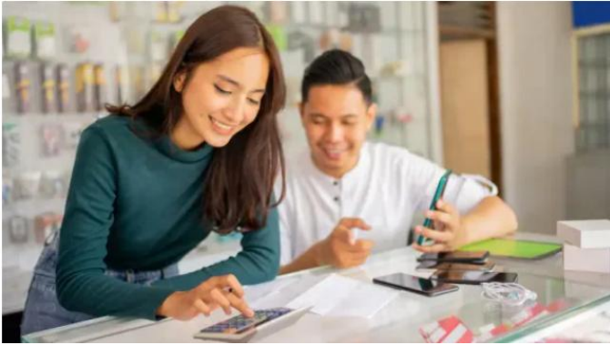
Gambar 2.1. UMKM Melakukan Manajemen Keuangan

Banyak pelaku UMKM yang berfokus pada produk, pemasaran, dan penjualan, tetapi sering kali mengabaikan aspek keuangan. Mereka mungkin merasa bahwa selama ada uang masuk, bisnis mereka baik-baik saja. Namun, pandangan ini sangatlah keliru dan berbahaya. Keputusan-keputusan penting seperti menentukan harga jual, menambah stok, membeli peralatan baru, atau mengajukan pinjaman yang semua berakar dari data keuangan yang akurat. Keuangan yang dikelola dengan baik memungkinkan pemilik usaha untuk melihat gambaran utuh tentang kondisi bisnisnya dan membuat keputusan yang terukur. Apakah bisnis benar-benar menguntungkan? Apakah ada kebocoran dana? Apakah ada potensi untuk ekspansi? Jawaban dari semua pertanyaan ini hanya bisa ditemukan melalui catatan dan analisis keuangan yang sistematis.