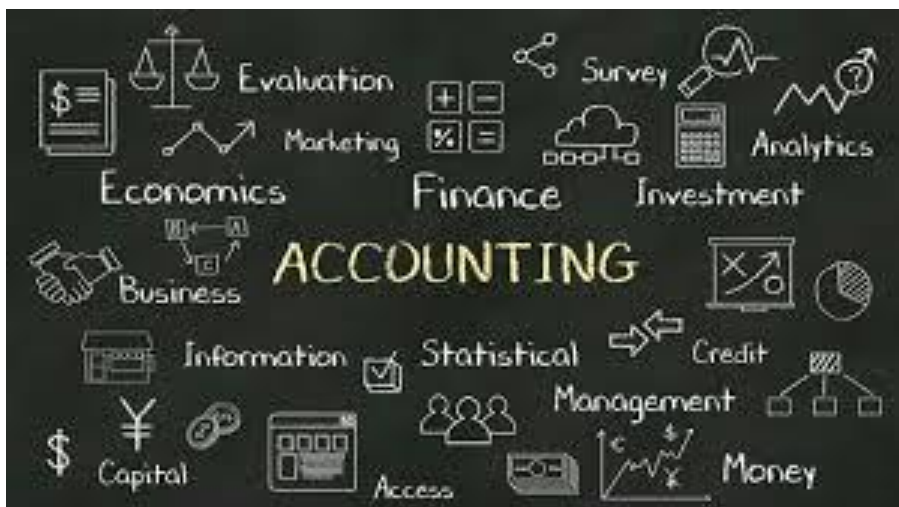
Gambar 6.2 Dasar Akuntansi