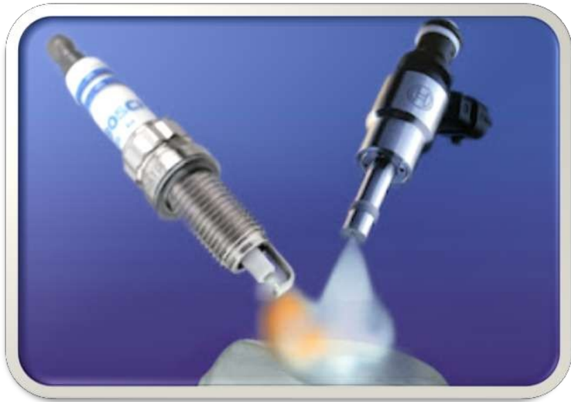
Gambar 3. 1 Sistem Injeksi Bahan Bakar

Sumber pencemaran udara lebih dari 75% disebabkan oleh kendaraan bermotor. Mengingat hal itu produsen kendaraan berlomba menciptakan kendaraan rendah emisi. Aplikasi teknologi injeksi bahan bakar pada motor bensin merupakan salah satu upaya menciptakan kendaraan yang rendah emisi. Selain rendah emisi, aplikasi sistem injeksi juga memungkinkan