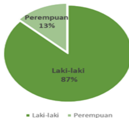
Gambar 1. Persentase Responden

Karakteristik responden tidak terbatas pada perempuan ataupun laki-laki karena responden laki-laki dapat memberikan persepsi terhadap peran dan partisipasi perempuan terhadap kegiatan konservasi. Persepsi dalam hal ini dimaknai sebagai pandangan, pengamatan atau tanggapan orang terhadap suatu benda, kejadian, tingkah laku manusia, atau hal-hal yang ditemui sehari-hari. Berdasarkan data yang diperoleh, jumlah responden laki-laki diperoleh lebih banyak daripada jumlah responden perempuan. Persentase responden disajikan dalam gambar 1 berikut