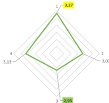
Gambar 3. Keterlibatan dan Peran Perempuan dalam Konservasi

Berdasarkan analisis rata-rata dari aspek penilaian maka poin nomor 1 mendapat nilai rata-rata tertinggi. Poin nomor 1 ialah keterlibatan dan peranan perempuan dalam perencanaan kegiatan konservasi dengan rata-rata 3,27 sehingga dapat disimpulkan bahwa dalam kegiatan konservasi perempuan memiliki peran tertinggi dalam perencanaan. Berikutnya pada poin nomor 4 yaitu pelaporan rata-rata nilainya adalah 3,13. Setelah itu poin nomor 3 yang merupakan poin pengambilan keputusan memiliki nilai rata-rata 3,07. Rata-rata terendah terdapat pada poin nomor 4 yakni mengenai pelaksanaan kegiatan konservasi dengan nilai 2,94.