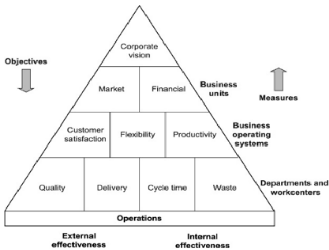
Gambar 3.2. Piramida Kinerja (Tangen, 2004)

Meskipun dalam tahun 1992 telah dirumuskan satu model kinerja dengan priada terbalik akan tetapi dalam pendekatannya yang talah menggabungkan kinerja organisasi secara top down dan bottom up sebagaimana Piramida Kinerja . Itu diusulkan oleh Cross dan Lynch (1992), sebagai berikut :