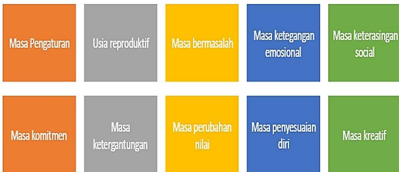
Gambar 3. ciri umum perkembangan fase dewasa awal

Dewasa awal merupakan puncak pertumbuhan fisik yang prima sehingga dipandang sebagai usai paling produktif. Pada usia tersebut masih sering mengalami kegagalan dalam proses mencapai kedewasaan misalnya 1) sulit mencari kerja, 2) sulit mencari jodoh, 3) ingin menikah tapi belum ada penghasilan, 4) setelah menikah mengalami kesulitan dalam mengurus anak (Gambar 11.1)