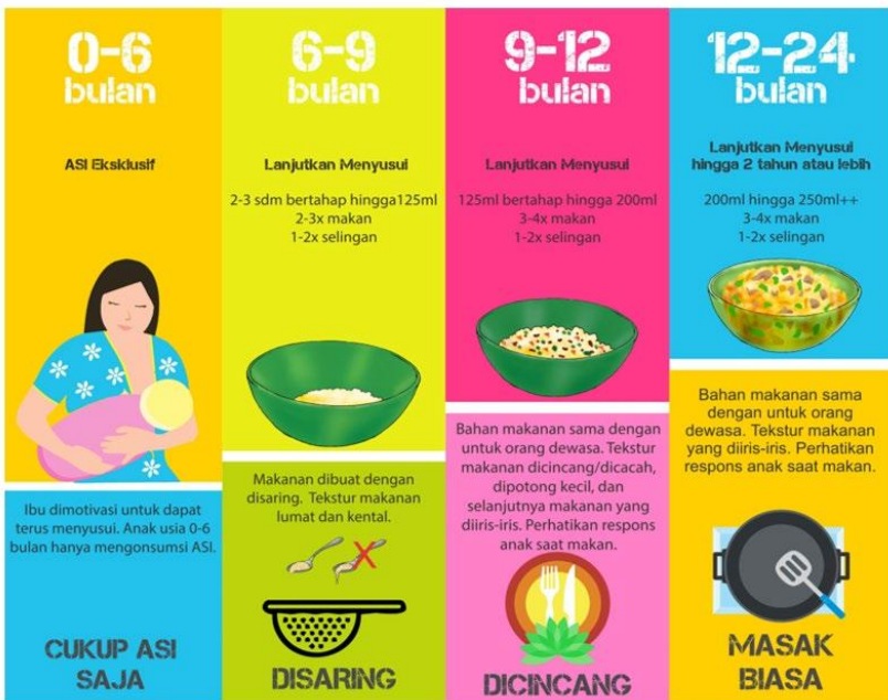
Gambar 1. Panduan Cara Penyajian, Porsi, Tekstur dan Frekuensi Makan Untuk Bayi dan Anak

Proses pemberian MP-ASI wajib dilakukan secara gradual, baik dari aspek porsi maupun tekstur, dengan menyesuaikan pada kesiapan fungsional organ pencernaan bayi. Mengingat periode ini merupakan fase pertumbuhan fisik dan perkembangan kognitif yang sangat krusial, pemenuhan nutrisi yang adekuat secara kualitas dan kuantitas menjadi faktor penentu. Oleh karena itu, penyesuaian tekstur, porsi, dan frekuensi makan harus dilakukan secara konsisten hingga anak mencapai usia satu tahun agar selaras dengan kematangan anatomi tubuhnya.